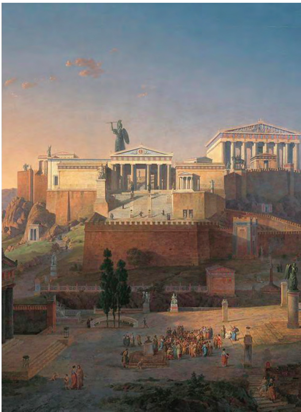
Uppbyggandet av Akropolis och Areus Pagus i Aten. Leo von Klenze, 1846.